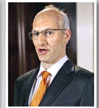
... Pascal Couchepin: «Isch brauche keine Diskussion», findet der Bundesrat.