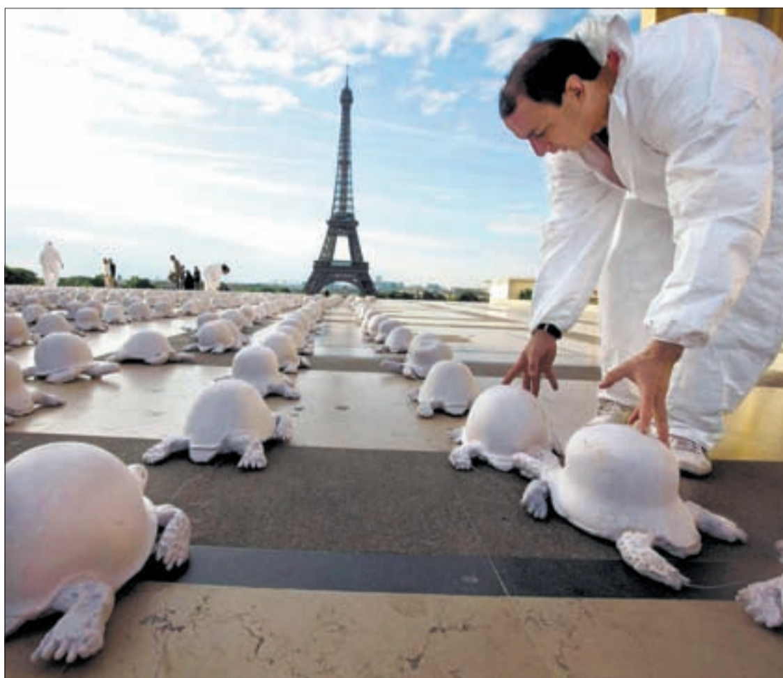
In Reih und Glied zum Gedenktage: Schildkröten, gefertigt aus Soldatenhelmen.

gesammelt und diese in Schildkröten verwandelt. Treffender kann man den Frieden wohl nicht symbolisieren. Doch der Künstler will nicht nur der Vergangenheit gedenken. Die Schildkröten stehen auch als Mahnmal gegen etwelche heutige Gewalt – angesichts des drohenden Wiederaufflammens des weltweiten Terrors ein symbolträchtiges Zeichen. Hätten wir einen Wunsch für die Zukunft offen, könnte er so lauten: Möge dereinst ein neuer Feiertag eingeführt werden, an dem wir des offiziellen Endes des durch religiöse Verirrungen provozierten Terrors gedenken.